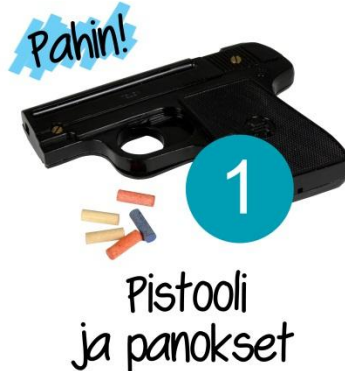
Pistooli ja panokset